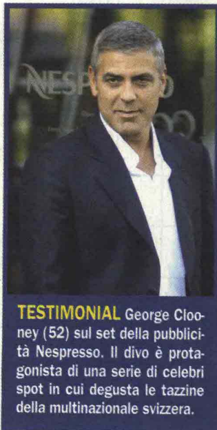
TESTIMONIAL George Clooney (52) sul set della pubblicità Nespresso. Il divo è protagonista di una serie di celebri spot in cui degusta le tazzine della multinazionale svizzera.

i ragazzi di oggi hanno un'altra cultura, sono diversi. Noi adulti siamo sempre entrati in ditta a testa bassa. Io, per esempio, sono partita dal centralino: un'esperienza fondamentale per conoscere davvero tutta l'azienda. Non è detto che i nostri figli sappiano partire con la stessa umiltà», conclude.